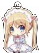
カットパスに アタッチメントを差し込む