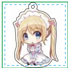
デザイン・カットパス 配置参考