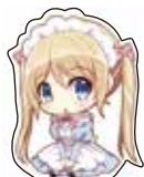
カットパスと アタッチメントを用意